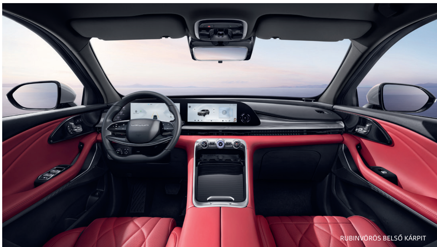
RUBINVÖRÖS BELSŐ KÁRPIT