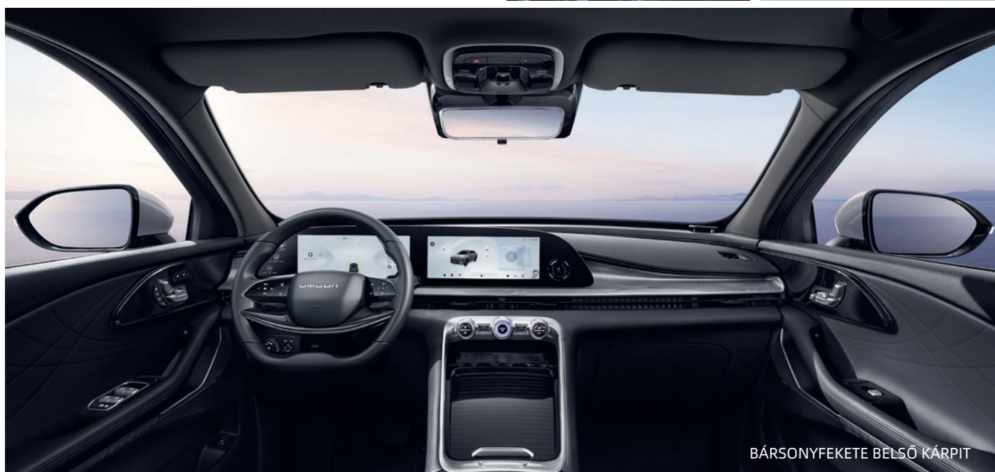
BÁRSONYFEKETE BELSŐ KÁRPIT

A Genius Automotive Europe Kft. a mindenkori változtatás jogát, illetve az előzetes bejelentés nélküli műszaki adatok és felszereltségi tartalmak módosításának jogát is fenntartja. Az általunk forgalmazott összes OMODA modellel teljes körű, általános, gyári műszaki garanciát vállalunk 7 év vagy 150.000 km futásteljesítményig, céges ügyfeleknek egyaránt. A pontos részletekért kérjük forduljon hivatalos O&J márkakereskedőjéhez vagy érdeklődjön a www.omodahungary.com weboldalon.